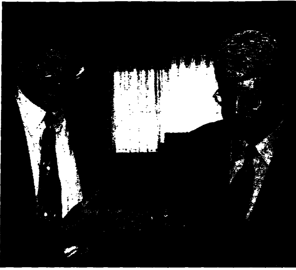
للبري الامريكاني وزير الخارجية الاسرائيلي يتحدثان مع مسؤولين فلسطينيين بعد اجتماعهما امس (ديتير)

طرح لوفك الفلسطيني من قضية الامن مستورا اياها جزوا بتجزأ من عملية سياسية شاملة واته لا يتوجب كيف ان الامن يتم تحقيقه من خلال تجميع ضعب وبكامل العمل على الاتانه والقيادة وجرماته من اللذام والذم والاعتزاز والاستيطان وعدم تنفيذ الاتفاقيات للوفاء. وقال ان عرفات ان الجانب الاسرائيلي طلب خلال اللقاء بمودة للتسليم الامني الثاني واستمراره كما كان في السابق. وتابع قائلا ان الجانب الفلسطيني رد بان مستوى وشكل للتسليم الامني السابق مرتبط تماما وبشكل العلاقة السياسية بين الطرفين، فالتسليم في صيغته السابقة استند الى